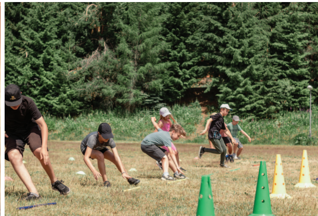
Piaristický tábor, Skalka pri Kremnici, 3. - 9. júla 2022