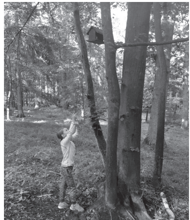
Jedna z najzaujímavejších kešiek