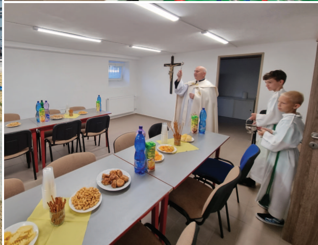
Požehnanie farského pastoračného centra v Prievidzi, 3. júla 2022