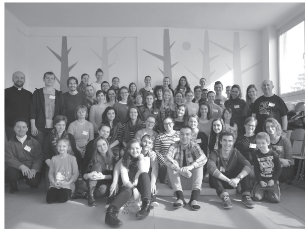
Spoločné stretnutie animátorov eRka z Banskobystrickej diecęzy

Keď som nastúpil do úlohy prefekta, moja práca s mladými nadobudla nový rozmer. Angažoval som sa už iba v rámci eRka, kde som pomáhal pri rôznych kurzoch ako súčasť tímu, a samozrejme, ako kňaz. Pripravoval som aj rozmanité zamyslenia a duchovné obnovy pre animátorov. Posledných desať rokov pôsobím v eRku ako kňaz, ktorý vedie Duchovno-pastoračnú komisiu eRka. Sú v nej kňazi za každú diecēju,