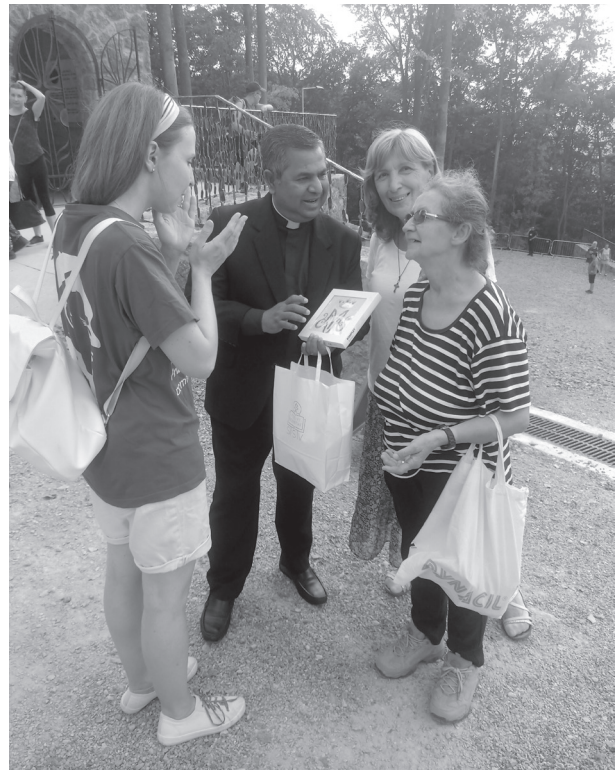
Odovzdávanie daru riaditeľovi PMD zo Srí Lanky