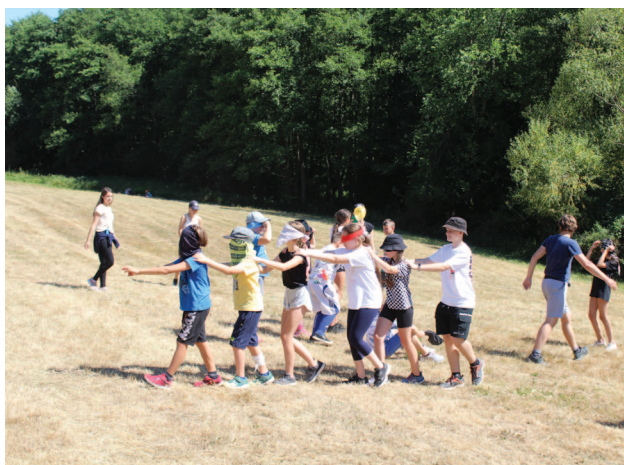
Farský tábor, Kostolány pod Tribečom, 17. - 23. júla 2022