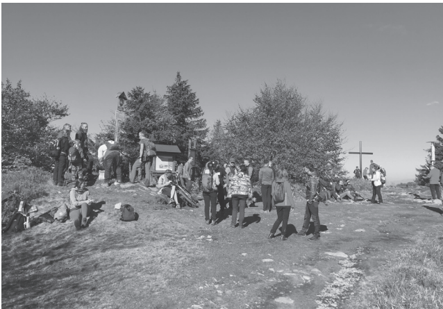
Kešeri sa radi stretávajú - event k 20. výročiu založenia geocachingu na Vtáčniku

Text: Mária Orság